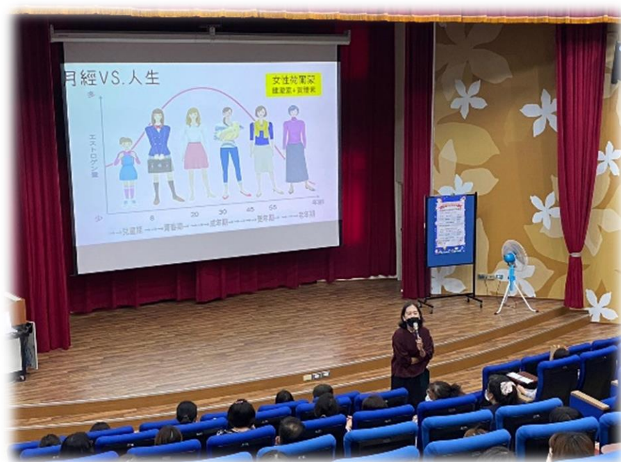
圖7 新竹縣教育局舉辦月經教育及性別平等教育教師及護理師研習

教育局與民間企業這項合作的目的除了解決偏鄉地區學童在月經期間面臨的困難，特別是因為經濟原因無法獲得足夠的生理用品所帶來的困擾，也透過這次的計畫，希望能提升這些學童的生活品質，讓他們在學習和日常生活中不再因生理期而感到不便或困擾。此外，教育局也針對月經平權教育，發展了在地教材，讓各校使用，以及辦理月經教育及性別平等教育教師及護理師研習，促進社會對月經平權的關注與重視，消除圍繞月經的偏見與污名。