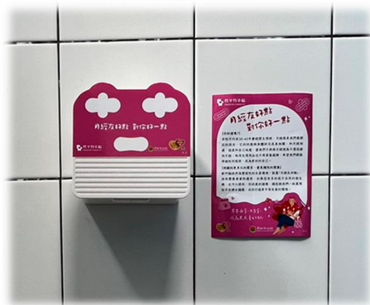
圖8 於廁所設置月經盒

教育局所提供這些月經平權教育資源不僅改善了學童的學習環境，也促進了學校內更加開放和包容的氛圍。