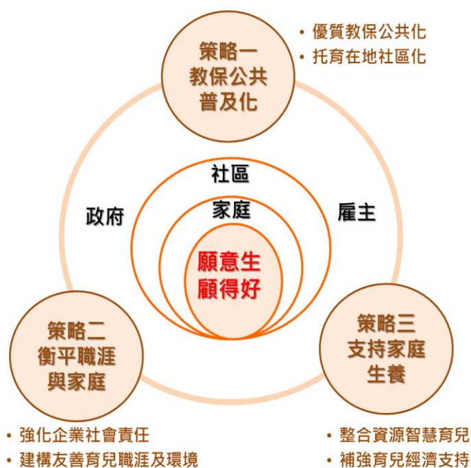
圖 2：完善生養環境方案強化策略架構