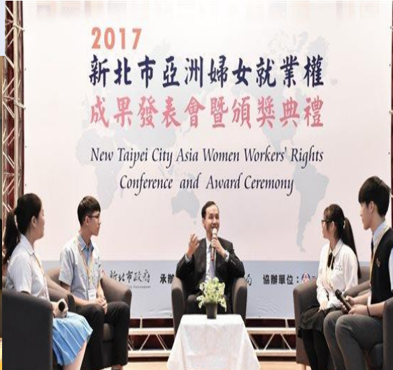
模擬聯合國會議 學生扮演外交官 探討性平