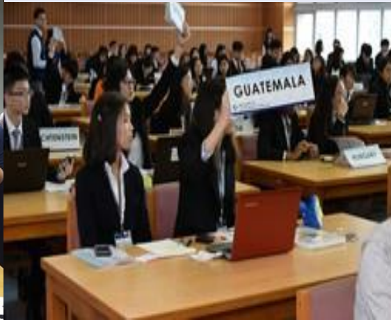
模擬聯合國會議 學生扮演外交官 探討性平