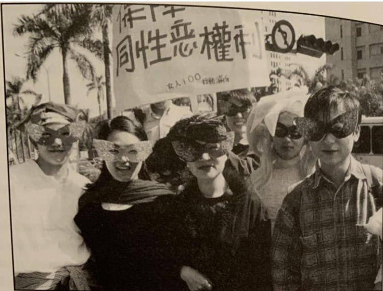
Photograph 7.1 Masked tongzhi demonstrators at the 1996 Women's Day march. The placard reads 'Protect tongxinglian rights'.