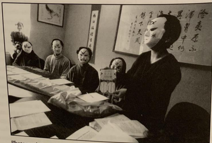
Photograph 7.2 Masked activists from the Tongzhi Space Alliance meet with the Taipei City Government in 1996.

Masked tongzhi (同志) demonstrators at the 1996 Women's Day march