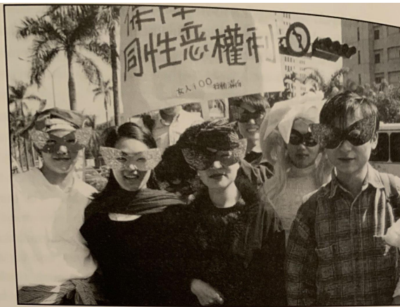
Photograph 7.1 Masked tongzhi demonstrators at the 1996 Women's Day march. The placard reads 'Protect tongxinglian rights'.