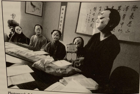
Photograph 7.2 Masked activists from the Tongzhi Space Alliance meet with the Taipei City Government in 1996.

Masked tongzhi (同志) demonstrators at the 1996 Women's Day march