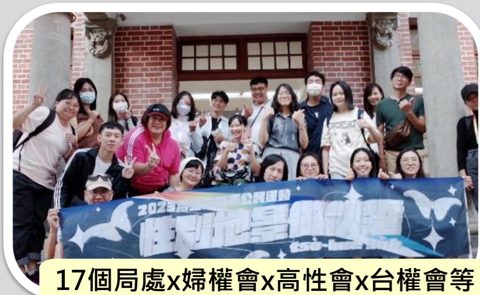
17個局處x婦權會x高性會x台權會等