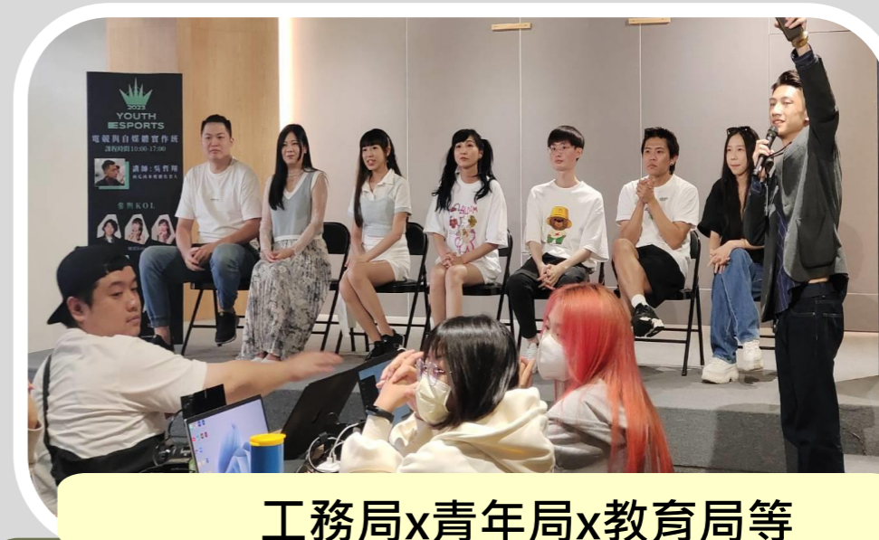
工務局x青年局x教育局等