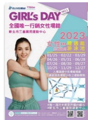
【圖說：左為三芝數位中心主播體驗工作坊；右為三重國民運動中心女孩運動日活動】