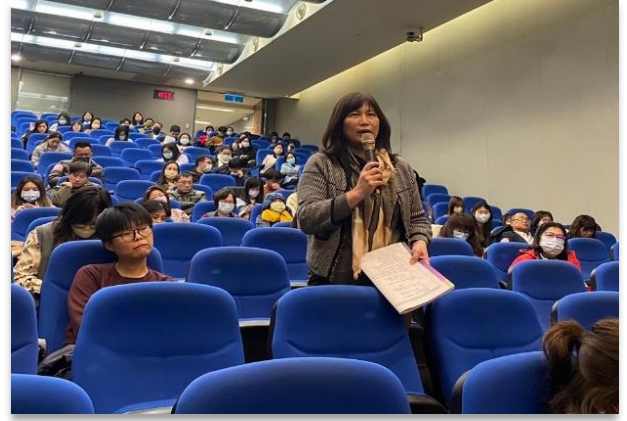
【圖說：左為綜合座談主持人及與談人；右為桃園市性別平等辦公室執行長提問及交流】