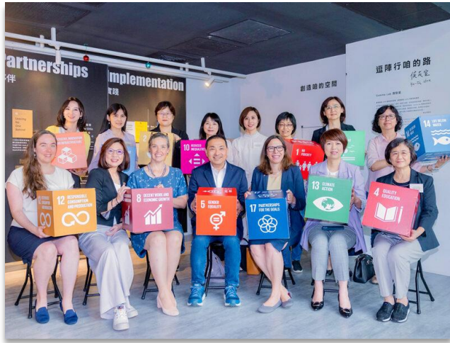
【圖說：侯友宜市長帶女性首長共同接待美國在臺協會(AIT)理事會主席 Laura Rosenberger】