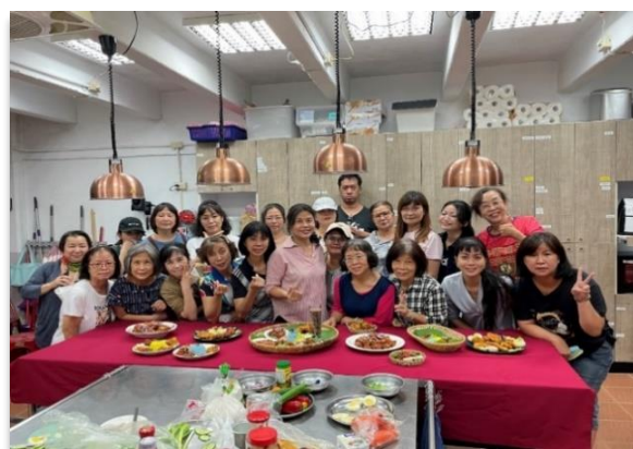
【圖說：左為《燦爛新女力》新書發表會；右為新住民學習中心亞洲文化與美食課】