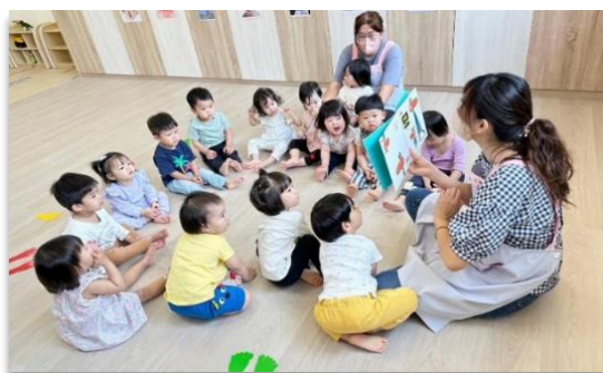
【圖說：左圖為地政專車服務情形；右圖為公托中心服務情形】