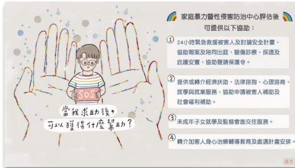
【圖說：同志親密關係暴力防治懶人包內容，引導民眾認識親密關係暴力及求助管道】