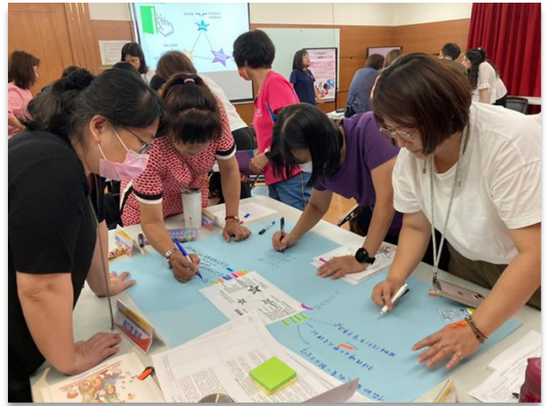
【圖說：針對本市在地婦團辦理 CEDAW 議題培力工作坊，並分組凝聚具體政策建議】