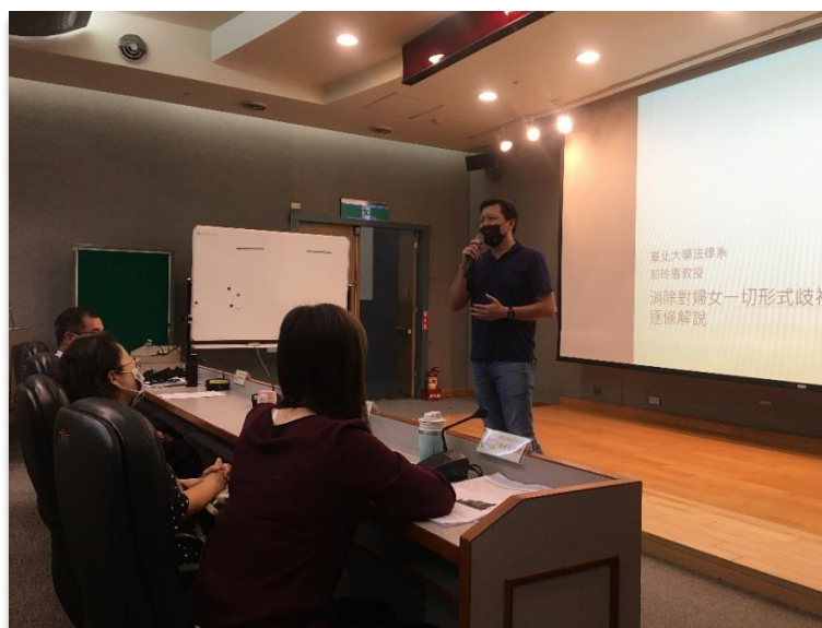
【圖說：本市朱副市長(時任副秘書長)主持城市報告教育訓練說明推動城市報告重要性】

透過在歷次性平相關會議及活動的長官致詞參考稿中，加入本府落實 CEDAW 相關政策之數據及資料，並主動宣示推動 CEDAW 城市報告作業計畫，強調自我檢視本市性別平權推動的重要性，以爭取府層級長官支持，並藉由公開場合向各局處顯示本府推動 CEDAW 以及完成城市報告的決心；另由府層級長官親自主持 CEDAW 城市報告工作坊教育訓練，並說明新北市 CEDAW 城市報告推動計畫，提升各局處推動意願與配合度。