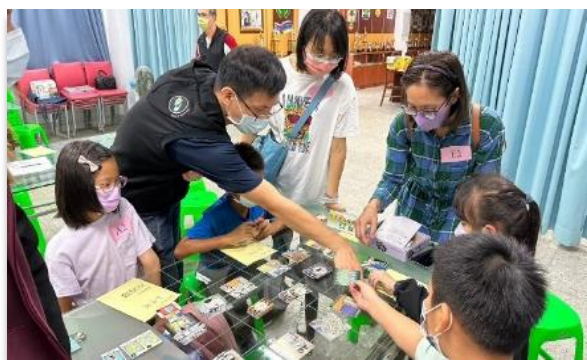
【圖說：左為員警受理數位性別暴力案件教育訓練；右為防治數位性暴力親職講座】