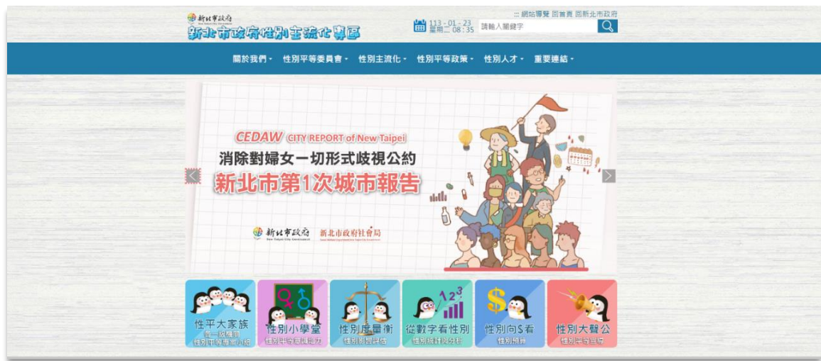
【圖說：新北市 CEDAW 城市報告電子書公告於本府性別主流化專區】

此外，本市各區公所雖未參與城市報告書之撰寫，但為持續在地深根 CEDAW，本府社會局將本市 CEDAW 城市報告推動歷程及成果內容，結合區公所在地實踐及推動 CEDAW 之案例製成教材，於社政主管會報中，對 29 區公所課室主管辦理教育訓練，使各區公所瞭解本府各機關 CEDAW 相關政策精神與推動情形，後續可於推動在地化性平政策時融入 CEDAW 公約精神；參訓人數共計 29 人。