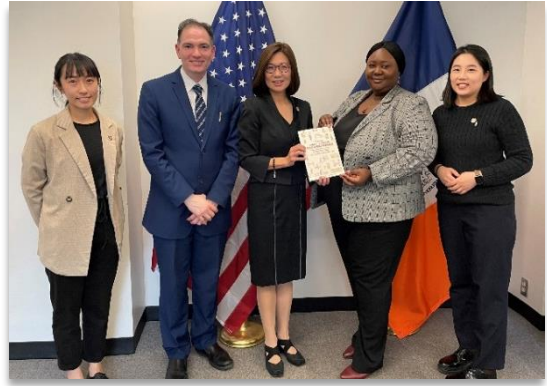
【圖說：左為出席 CSW67 平行論壇會議；右為贈送本市 CEDAW 城市報告予紐約市】