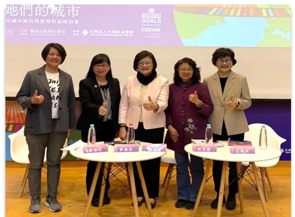
【圖說：左圖為研討會開幕合影；右圖為第二場次主持人、報告人及回應人】