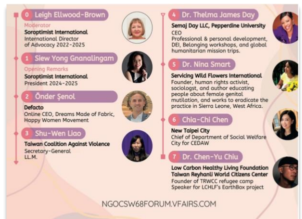
【圖說：本府辦理 NGO CSW68 平行論壇場次宣傳 DM】