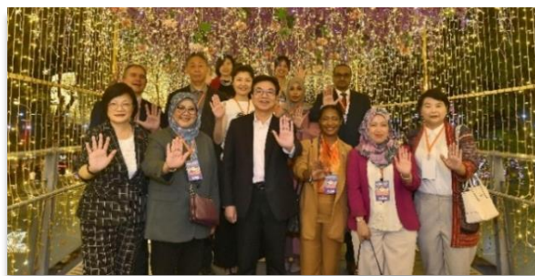
【圖說：每年皆邀請駐外使節並由首長親自參與橘色反性別暴力倡議活動】