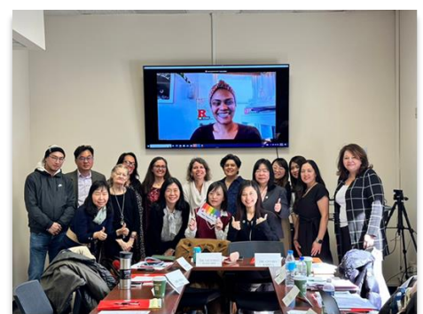
【圖說：本府向美國羅格斯大學 CWW 及 REV 分享推動 CEDAW 成果與會後合影】