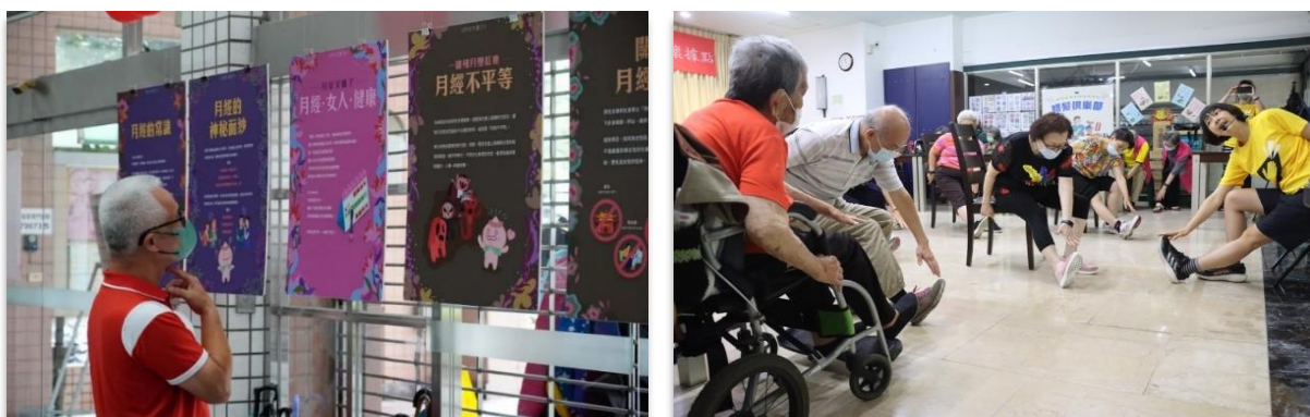
【圖說：左為民眾駐足月經平權巡迴展；右為長者參與銀髮俱樂部老師帶動伸展運動】

為回應 CEDAW 一般性建議第 24 號第 12 段(a)女性有別於男性的生理因素，如有月經週期，故應正視其健康權利，本府推動「月經平權三部曲」：消除月經貧窮、提倡月經平權、引導月經時尚，藉由舉辦跨局處倡議記者會，由市長帶領各局處共同呼籲重視月經平權議題，本府於 2022 年至 2023 年提供 11 處管轄空間及 77 處服務台供急需民眾索取生理用品，並舉辦 2 場次宣導 713 人次參與、7 場次月經經驗團體、18 小時宣導員培訓工作坊培訓 13 位宣講員、5 場次月經巡迴展及 50 場次社區宣導；針對高風險及身心障礙孕婦提供追蹤關懷服務，透過產前諮詢及產後追蹤照護服務，連結新北境內 35 家產檢機構及助產師(士)公會提供追蹤關懷，以落實 CEDAW 一般性建議第 24 號第 31 段(c)提供安全孕產服務和產前協助，截至 2023 年高風險產婦服務總數已超過 6,000 人，身心障礙孕產婦達 94 人；另經由健保署醫療服務點及本府自行設置的醫療服務點共 37 點，提供偏鄉及農村婦女就近取得醫療資源，回應 CEDAW 第 34 號一般性建議保障農村婦女及女童醫療權利，截至 2023 年已提供 1,455 診次、服務 1 萬 6,231 人次；而為回應 CEDAW 一般性建議第 27 號第 45 段確保為高齡女性、包括高齡身心障礙婦女提供醫療保健服務，本府針對高齡女性健康促進及醫療照顧服務依照失能人口使用服務狀況，建置完善超齡照顧系統及友善就醫服務，並針對中高齡健康促進連結銀髮族俱樂部 1,188 處、老人共餐點 1,082 處、社區關懷據點 558 處，服務人數達 457 萬人次。