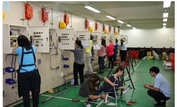
【圖說：左圖為坐月子到宅服務員訓練；右圖為室內配線職訓女性專班】