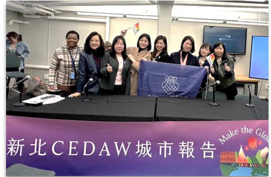
【圖說：論壇尾聲與談者合影留念且本市議員到場支持】