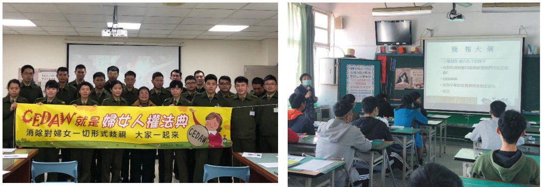
↑圖 5：利用 CEDAW 教材至苗栗憲兵隊及足球裁判研習會宣講性平

受傳統父權文化影響，職業選擇仍尚存性別刻板印象之限制，在以男性為主的職場中，對於性別迷思釐清及對於女性的尊重與支持更顯重要，因此，本府秘書單位特選針對憲兵隊、中國石油探勘處、足球裁判研習會辦理宣講，深入以男性主場的場域，利用簡潔易懂的宣導教材，深化性別觀念。