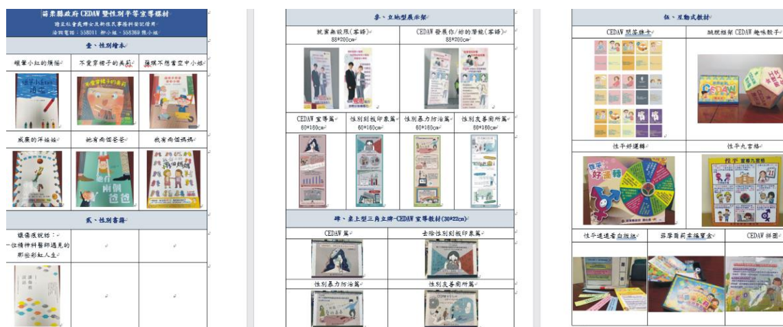
↑圖 7：建置目視化宣導媒材庫

條、手拿牌、海報，摺頁、多媒體影片等。並由本處主動辦理性平教材工作坊，介紹所自製各式教材，示範實務操作與分享推動經驗，鼓勵各局處夥伴多加運用。自 108-110 年 26 個局處中心運用本府自製媒材辦理對內、外宣導，借用次數共 135 次。