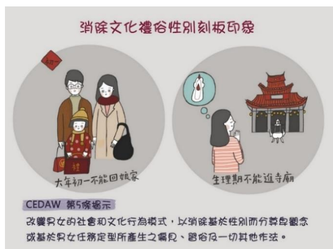
→圖 3：110 年第 1 季開機畫面宣導，撥放期間 110.2.22-3.3

本府計畫處資訊科辦理性平虛擬宣導，於本府各單位同仁之公務電腦開機時啟動「性平報報」網頁訊息，自 109 年第四季起，每季輪播各主題懶人包圖像，讓府內同仁皆能在辦公環境中深植性平觀念。