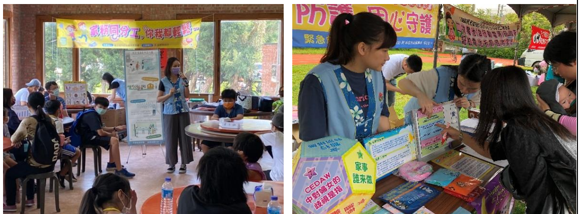
↑圖 8：利用自製 CEDAW 宣導教材融合自身業務辦理宣導

本府 26 局處中心利用本府自製 CEDAW 宣導教材，融合自身業務運用會議、活動、宣導攤位等各項傳播媒介，推廣 CEDAW 及性平概念。自 109-110 年間共辦理 52 場，參與民眾總計超過 7,152 人。