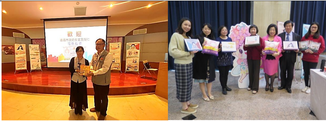
↑圖 9：分別與嘉義市府(左)與台中市府(右)辦理 CEDAW 宣導教材經驗分享

本自製媒材，把 CEDAW 結合第三次國家報告 73 點結論性意見篩選出符合業務實務四大主題，簡化繪製成淺顯易懂、文青討喜的懶人包，深獲本府性平委員肯定。