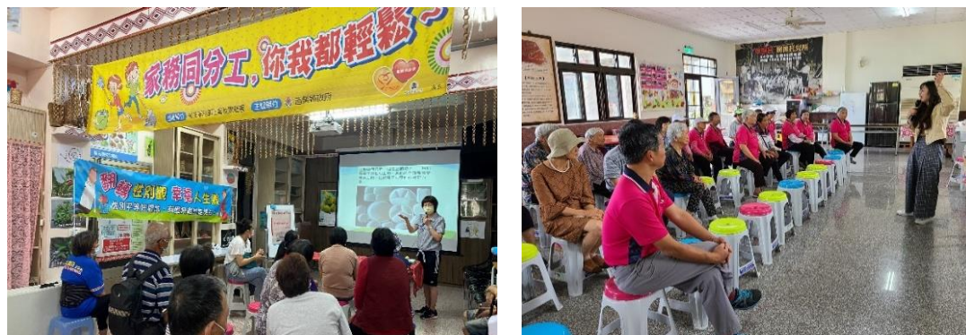
↑圖 6：性平種子社區講座

本府自 108-109 年辦理性別種子師資初、進階培訓課程，共計有 25 名參訓人員，其中有 7 位通過並納入性別平等宣導種子師資名單。為充分運用本府自製 CEDAW 教材，除將懶人包納入為種子培訓必要課程外，更作為 110 年各性平種子師資於進行社區宣講時之必要簡報媒材。109-110 年種子師資至社區宣講共 11 場，宣導對象包含苗栗山線客家及海線閩南族群，更深入泰安斯瓦細格原鄉部落，普及在地性平觀念宣導。