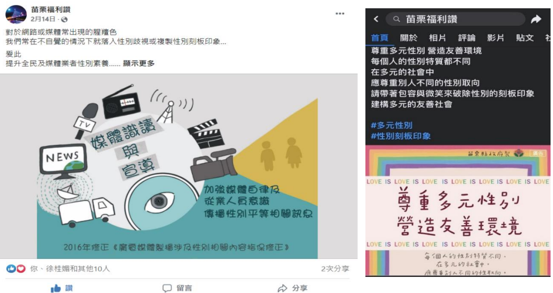
↑圖 4：每月於官方社群臉書平台「苗栗福利讚」貼文宣傳

為因應各式宣導管道，如結合會議、課程、活動、宣導專班等實體形式，或是運用社群網路宣導(Line、臉書、網頁登載)等數位形式，巧思規劃多項豐富實用性兼備之系列教材，包含三角桌牌、立地式展示架、海報、臉書梗圖、多媒體影音檔等，並應用於多項宣導品印製，提供本府各局處中心運用各種傳播途徑，讓各主題的 CEDAW 知識快速有效散播出去！