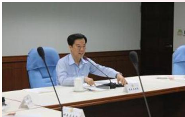
性平小組會議審查