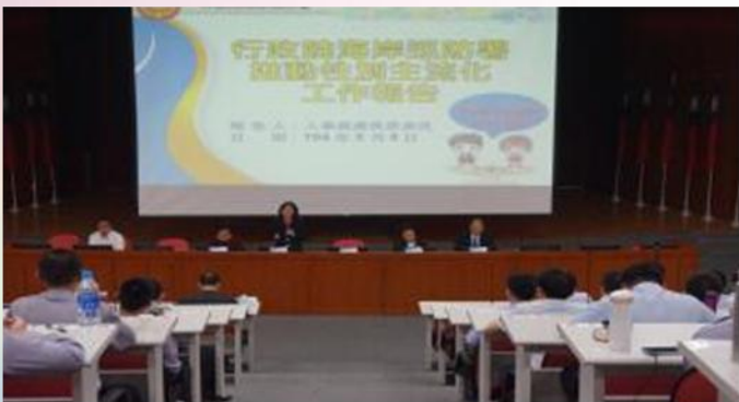
與警專合辦研討會時首播