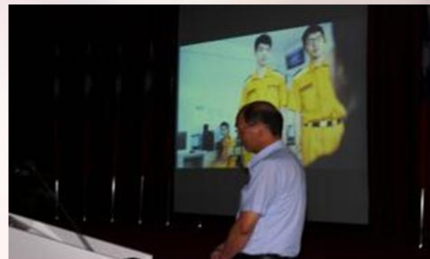
擴大署務會報播映