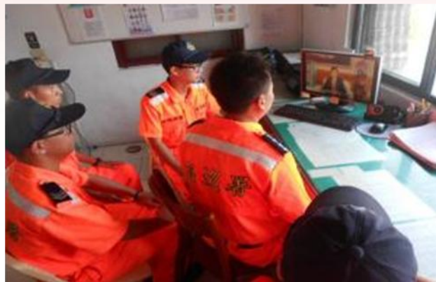
所屬收視2244人 (男2011、女233人)