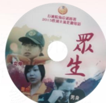
提供行政機關參考